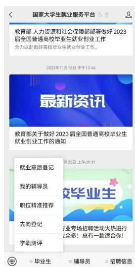
图 1 1 国家大学生就业服务平台公众号

学校、院系应发动毕业生关注绑定“国家大学生就业服务平台”公众号，毕业生可点击“去向登记”直接登录登记系统，还可接收到微信消息提醒，包括用人单位发起的签约邀请、学校（院系）的审核结果、去向登记信息被修改等，方便及时掌握去向登记进度。