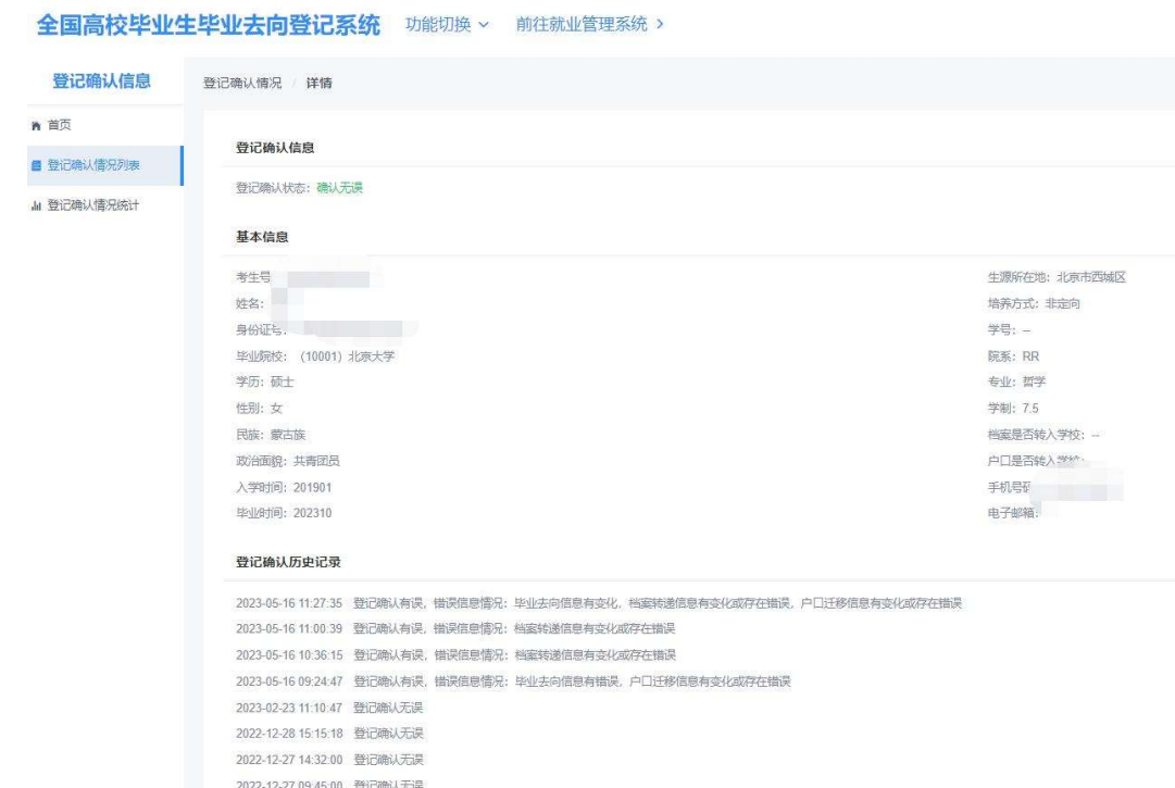
图 3 登记确认情况详情页