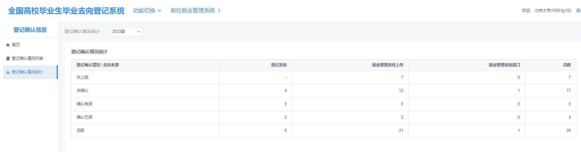
图 4 登记确认情况统计