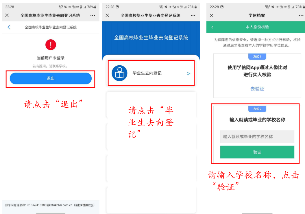
图 1 登录前可能出现的流程

确认个人信息无误后，进入去向登记确认界面。若本处信息有误，请联系学校就业指导中心修改。