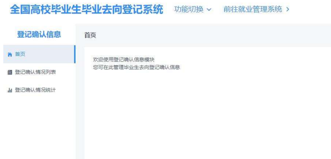
图 1 登记确认信息首页

学校、院系登录登记系统，点击“登记确认信息”进入主界面。主界面菜单栏主要包括登记确认情况列表、登记确认情况统计。