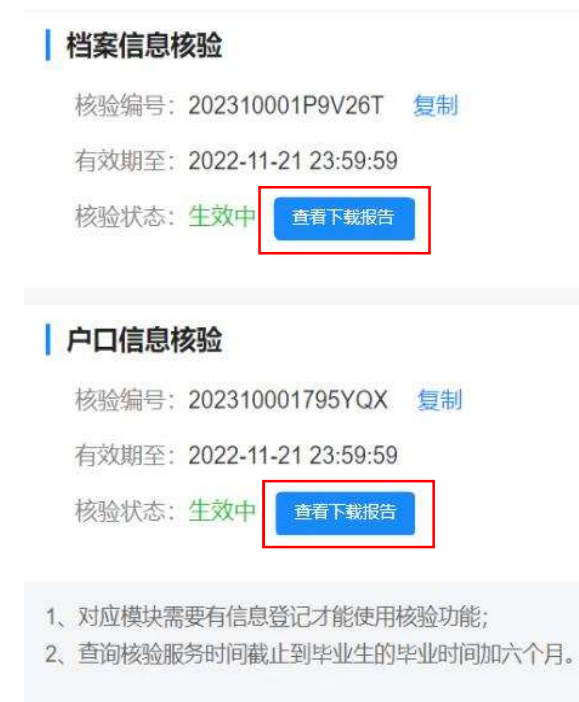
图 5 查看下载核验报告

去向登记信息核验报告分为档案信息核验报告和户口信息核验报告，内容主要包括核验编号、核验二维码、基本信息、毕业去向信息、档案转递信息或户口迁移信息。若毕业生在核验授