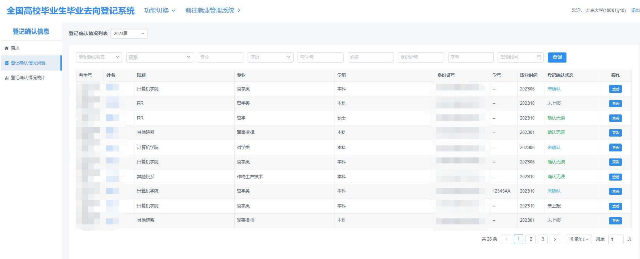
图 2 登记确认情况列表

毕业生提交确认信息后，若重新更新了毕业去向、档案转递、户口迁移等信息的重要字段，需重新进行登记确认，登记确认状态将重新变回“未确认”状态。