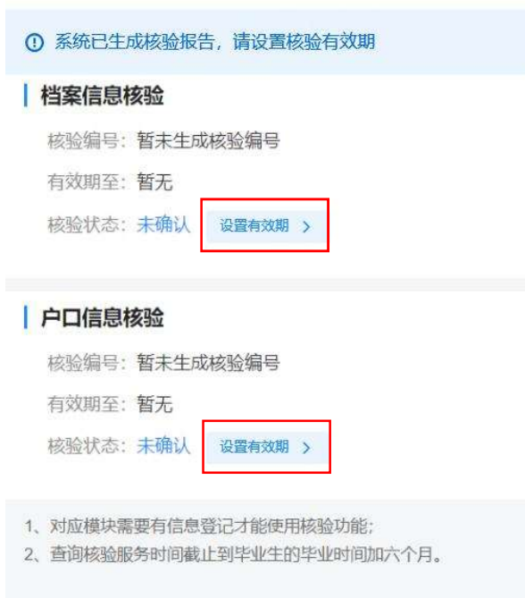
图 4 核验授权主界面