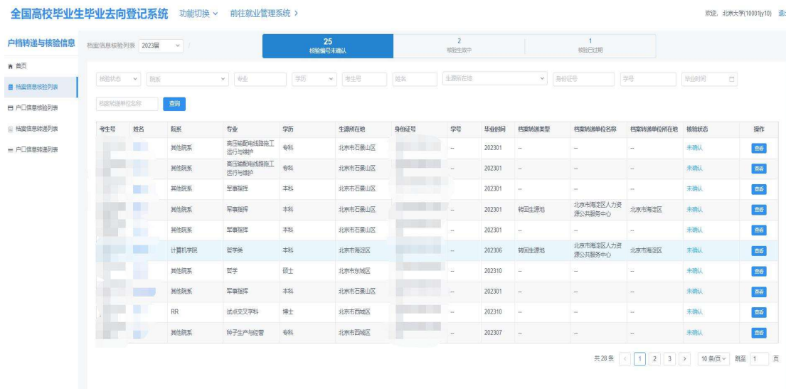
图 5 档案信息核验列表

毕业生完成登记确认后，生成带有“核验编号”的去向登记信息核验报告。点击“查询”按钮，学校可查看预览版在线核验报告。核验报告分为档案信息核验报告和户口信息核验报告，内容主要包括 核验编号、核验二维码、基本信息、毕业去向信息、档案转递信息或户口迁移信息 。“核验编号”为毕业生本人在完成实人认证的情况下单独授权生成用于户档转递的信息，不会展示给学校、院系等管理用户查看。若毕业生在核验授权时尚未登记档案转递信息或户口迁移信息，则核验报告将不展示档案转递信息或户口迁移信息。