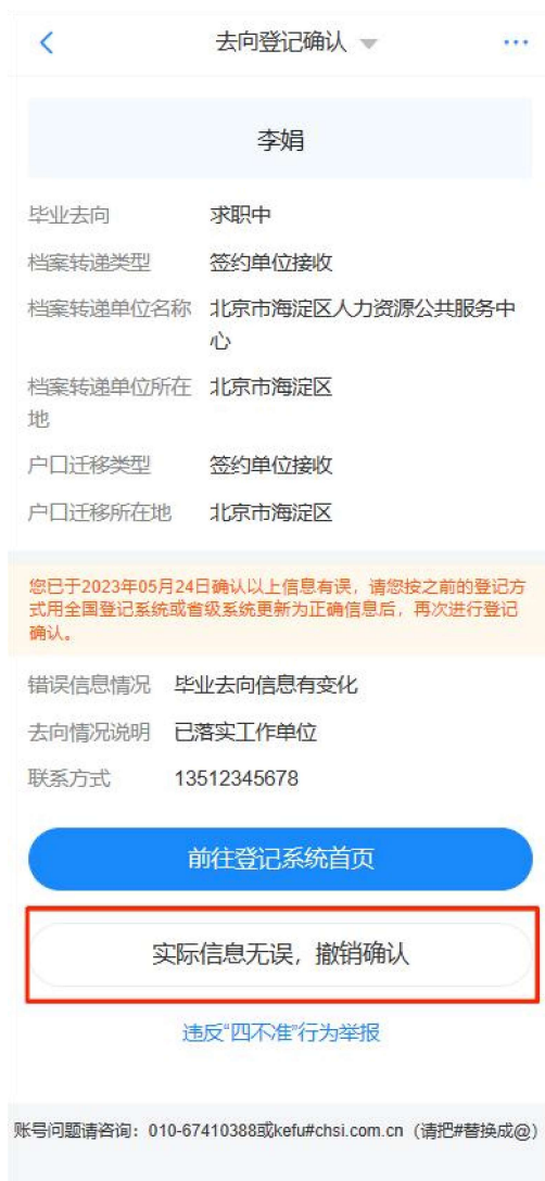
图 3 去向登记确认有误撤销